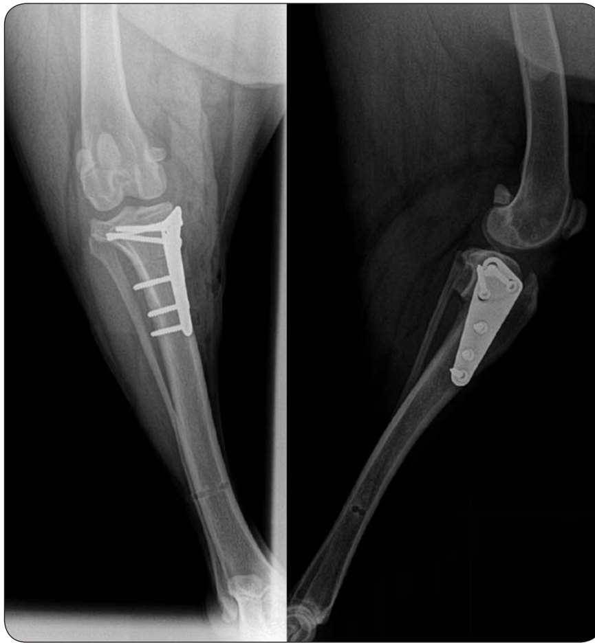
Ryc. 1. Prawidłowo wykonany zabieg TPO w dwóch projekcjach radiologicznych

▶ na zastosowany materiał – na biologiczne oraz z zastosowaniem tworzyw sztucznych. Do pierwszych należą próby stabilizacji poprzez odpowiednie przeszczepianie fragmentu mięśnia ( m. sartorius ) lub fragmentów powięzi oraz najczęściej z tej grupy wykorzystywana technika (1) przemieszczenia głowy kości strzałkowej (FHT). Są one zwykle łączone z metodami wykorzystującymi materiały syntetyczne. Metody tej drugiej grupy różnią się przede wszystkim metodami przeprowadzania materiału przez punkty izometryczne, rodzajem zastosowanego materiału oraz sposobem jego fiksacji (węzeł, zacisk, kotwa kostna). Większość metod z zastosowaniem materiałów syntetycznych przeprowadzana