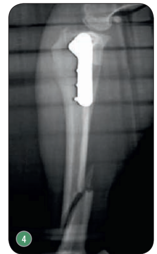
Ryc. 2. Złamanie guzowatości kości piszczelowej na skutek zbyt kranialnie przeprowadzonej osteotomii (fot. prof. Filippo Maria Martini z Uniwersytetu w Parmie); Ryc. 3. Punkty izometryczne na kości udowej i piszczelowej wykorzystywane w stabilizacji zewnątrztorebkowej; Ryc. 4. Złamanie trzonu kości piszczelowej z powodu umieszczenia gwoździa Kirschnera w części korowej kości (fot. prof. Filippo Maria Martini z Uniwersytetu w Parmie)

► że większość wymienionych powikłań możliwa jest do wyleczenia bez udziału kolejnej interwencji chirurgicznej.