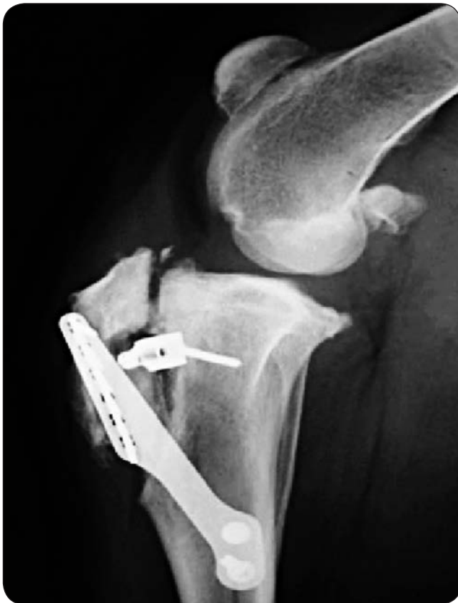
Ryc. 3. Zbyt dystalne umieszczenie klatki dystansującej i w konsekwencji złamanie guzowatości kości piszczelowej

które dyskwalifikują do podstawowej procedury TTA, jak psy z szeroką lub dystalnie położoną guzowatością piszczelową. Z pewnością wadą tej metody jest potencjalnie ryzykowne stosowanie jej u ras olbrzymich oraz o stromym TPA, tak jak w przypadku TTA.